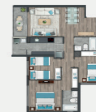
Departamento tipo D3.2

Sup. int. 61,13 m 2 Terraza: 4,04 m 2 Sup. total: 65,17 m 2 Sup. total DDU: 63,15 m 2