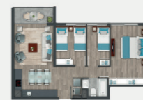
Departamento tipo D1.1

Sup. int. 54,64 m 2 Terraza: 2,08 m 2 Sup. total: 56,72 m 2 Sup. total DDU: 58,80 m 2