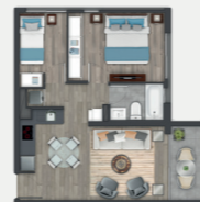
Departamento tipo B1.2

Sup. int. 35,87 m 2 Terraza: 3,64 m 2 Sup. total: 39,42 m 2 Sup. total DDU: 37,60 m 2