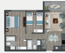
Departamento tipo C4.7

Sup. int. 51,88 m 2 Terraza: 3,75 m 2 Sup. total: 59,38 m 2 Sup. total DDU: 55,63 m 2