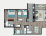
Departamento tipo D4.1

Sup. int. 69,66 m 2 Terraza: 4,04 m 2 Logia: 2,24 m 2 Sup. total: 75,96 m 2 Sup. total DDU: 72,82 m 2