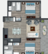
Departamento tipo C3.1

Sup. int. 59,25 m 2 Terraza: 0,00 m 2 Sup. total: 63,41 m 2 Sup. total DDU: 59,25 m 2