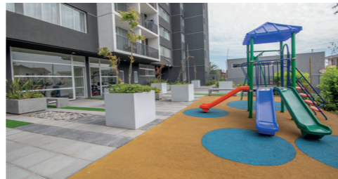
Zona de juegos