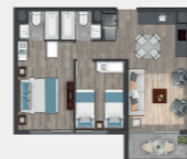
Departamento tipo C1.3

Sup. int. 59,29 m 2 Terraza: 7,5 m 2 Sup. total: 59,29 m 2 Sup. total DDU: 55,54 m 2