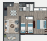
Departamento tipo B2.2

Sup. int. 53,08 m 2 Terraza: 3,9 m 2 Sup. total: 56,98 m 2 Sup. total DDU: 55,10 m 2