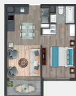
Departamento tipo A.1

Sup. int. 50,33 m 2 Terraza: 3,9 m 2 Sup. total: 54,23 m 2 Sup. total DDU: 52,28 m 2