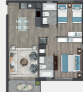
Departamento tipo C2.3

Sup. int. 46,44 m 2 Terraza: 3,78 m 2 Sup. total: 50,22 m 2 Sup. total DDU: 48,33 m 2