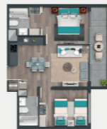
Departamento tipo C3.2

Line es un edificio de sólo 10 pisos, lo que crea una comunidad acotada con amplios espacios comunes. De 39.5 m 2 a 76.4 m 2